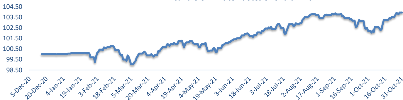
Ecuria e Cmimit te Kuotes e Fondit Miks

Duhet patur parasysh se norma e kthimit ndryshon ne varesi te kushteve te tregut dhe çmimi i kuotës mund të jetë i luhatshëm, pra nuk është statik apo gjithmonë në rritje, por edhe mund të bjerë si pasojë e ndryshimeve të kushteve në treg. Luhatshmëria është pjesë e natyrshme e fondeve te investimit dhe eliminimi total i saj është i pamundur. Investitorët e fondit Raiffeisen Miks dhe te gjithë fondeve te administruara nga Raiffeisen Invest keshillohen te kene nje horizont sa me te gjate investimi per te perfiturar nje